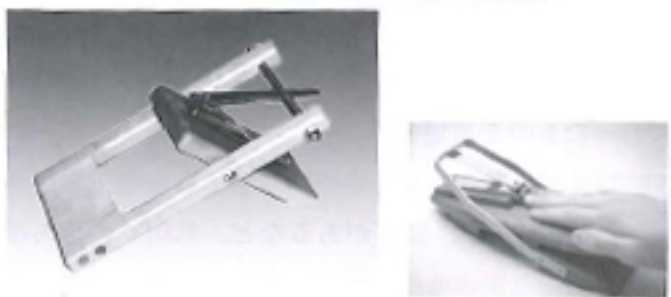
図表 4-2-51-② ワンハンド爪切り